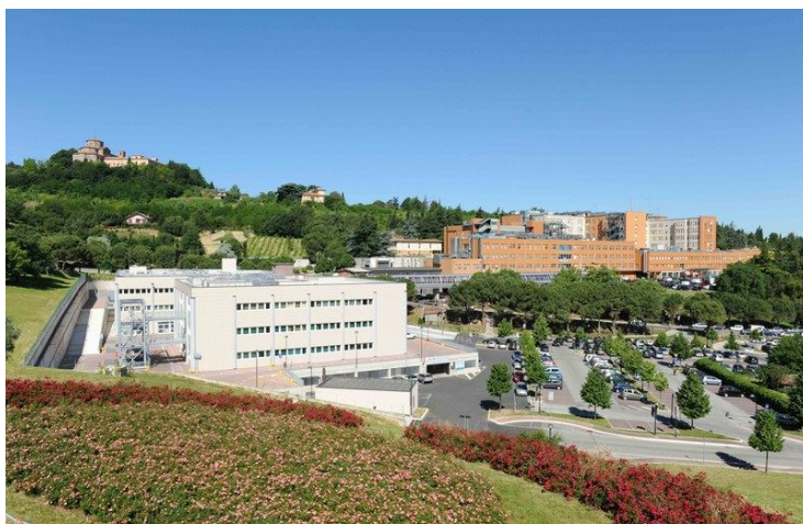
L'area del Bufalini vista dall'adiacente collina

sto problema da circa un anno, dopo avere anche avuto una ischemia, dovrebbe attendere quasi il triplo del tempo che gli è stato indicato da una dottoressa, naturalmente non a caso ma dopo una valutazione clinica. A meno che non si convinca a farsi fare il controllo prescritto in altre strutture sanitarie: alla figlia è stato detto che a Savignano o a San Piero in Bagno ad esempio si riuscirebbe, più o meno, a stare dentro il termine dei 6 mesi. Ma la donna fa notare che «soprattutto per un anziano, non è psicologicamente facile accettare di cambiare luogo di cura, cambiando le abitudini. Senza dimenticare il disagio dello spostamento, che per chi come lui è semi paralizzato non è un particolare trascurabile. Inoltre - prosegue la figlia dell'ottantenne - quando