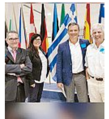
Il MSS: quattro consiglieri

Il MSS torna sul caso Dionigi: "In questi giorni ci è stato chiesto se ritorneremo in Consiglio dopo le dimissioni dell'assessore". Era impensabile continuare a stare in un "teatrino" vuoto e ipocrita, nel quale le decisioni vengono solo ratificate. Le dimissioni dell'assessore erano un prerequisito indispensabile per avviare un dialogo. Riteniamo che ad oggi non siano mutate le condizioni che lamentiamo, ma si è solo raggiunto il pre-requisito delle giuste dimissioni dell'assessore. Molte domande restano senza risposta: ci dica il sindaco Lucchi cosa intende fare per garantire più trasparenza, quali cambiamenti e se verrà istituita una commissione di controllo".