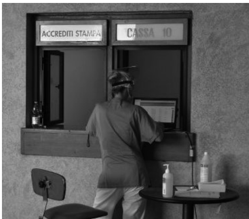
I controlli dei sanitari anche per le persone tornate dall'estero

«Questa è più materia per epidemiologi, ma a mio avviso non è neppure finita la prima. Siamo esposti al virus fino a che continuerà a propagarsi perché abbiamo gli anticorpi monoclonali deboli ed il terreno immunitario sgaurito. In questa fase per evitare il contagio possiamo fare quello che ci viene richiesto, mantenere il distanziamento ed usare la mascherina».