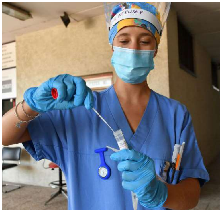
Una infermiera dell'Ausl Romagna con un tampone naso faringeo per il Covid 19

Il test che più garantirà questa percentuale di efficacia, sarà quello affidabile e, quindi, validato. E poi? «Servirà una settimana per le prove di laboratorio, poi potrà subito essere utilizzato. La semplificazione sarà enorme».