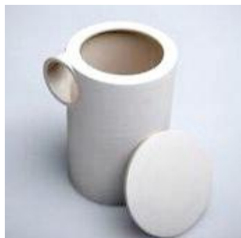
OPERA Una delle ultime creazioni di Pazienza

COME racconta Pazienza: «ho frequentato le scuole di Cesena e alle superiori frequentavo grafica pubblicitaria all'Istituto professionale Iris Versari. I professori dell'Iris mi hanno consigliato la scuola per le industrie artistiche Isia si Faenza ed è lì che è ricaduta la mia scelta per