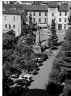
Piazza Berlinguer a Dovadola

«Il nostro gruppo - spiegano con entusiasmo i genitori dell'associazione - si propone di raccogliere idee e consigli per promuovere sempre nuove iniziative e laboratori rivolti ai bambini del nostro territorio e sostenere, in particolar modo, le attività scolastiche che per loro sono fondamentali. Raccogliamo fondi proprio per realizzare tali progetti».