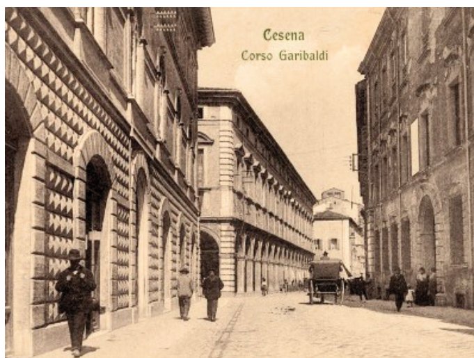
Palazzo Mori, sulla destra, a Cesena, dove abitava Imre Balazs

Iacuzzi e Gagliardo, pp. 47, 55, 106 e 119.