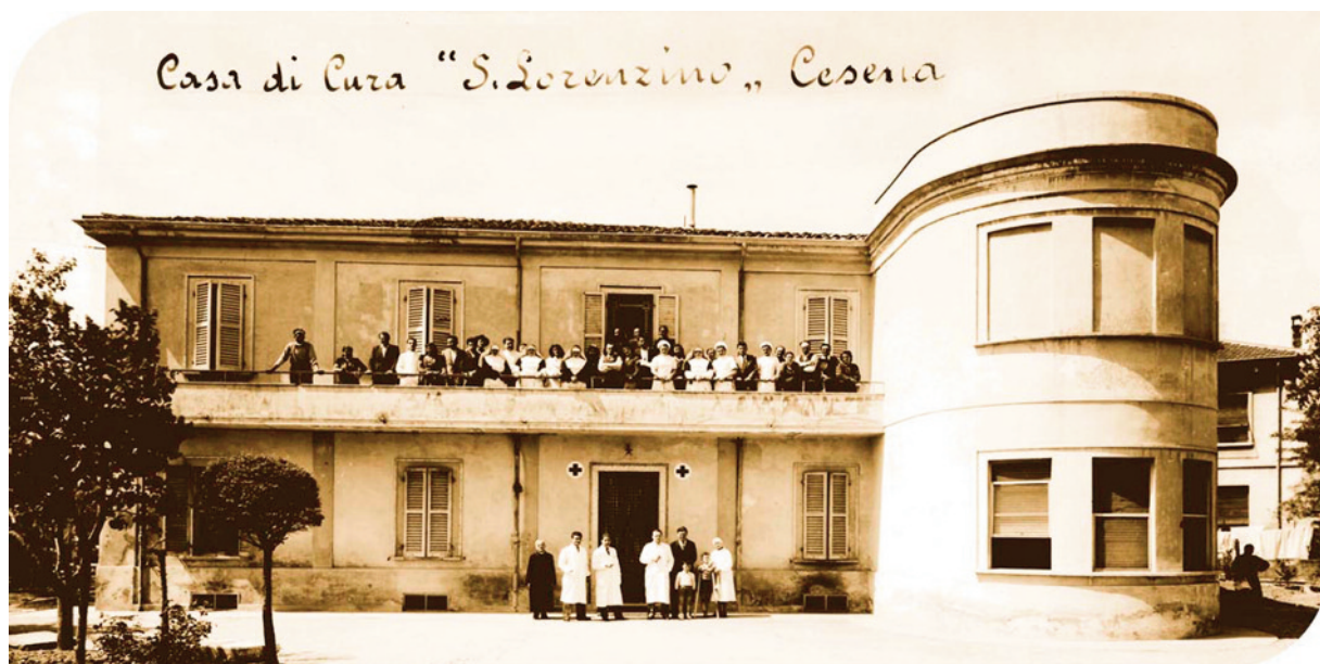
La clinica San Lorenzino a Cesena negli anni '50 del '900