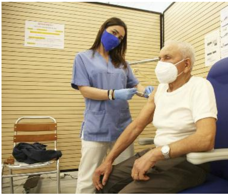
La somministrazione di un vaccino a un'anziano paziente al centro vaccinale di Pievesestina

Doppia novità sul fronte dei vaccini contro il Covid-19. Da lunedì prossimo, 26 aprile, in tutta l'Emilia-Romagna si aprono le agende per le prenotazioni per il vaccino dei cittadini dai 65 ai 69 anni, ossia i nati dal 1952 al 1956, e per chi non è in grado di affrontare la prenotazione on line scende in campo il Comando regionale dei Carabinieri. Già da ieri grazie a uno specifico accordo con la Regione Emilia-Romagna, i carabinieri delle tenenze e stazioni del territorio regionale, da Piacenza a Rimini, contribuiranno fattivamente alla campagna vaccinale in corso, venendo in aiuto della popolazione anziana in difficoltà per mancanza di strumenti informatici o minor dimestichezza con le nuove tecnologie. Basta recarsi presso la più vicina caserma dell'Arma per essere assistiti nella prenotazione per via telematica. E se c'è chi soffre qualche impedimento a spostarsi?