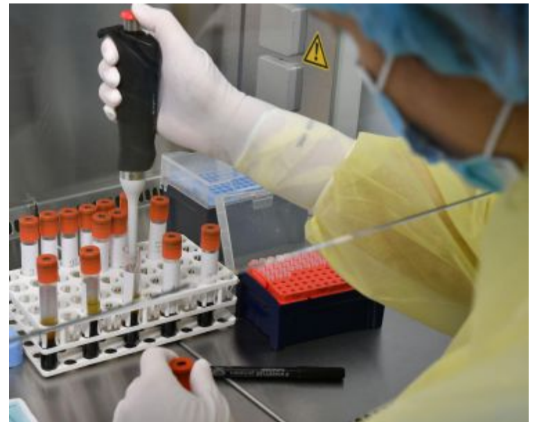
Dai tamponi processati il Forlivese ha il minor numero di positivi in regione