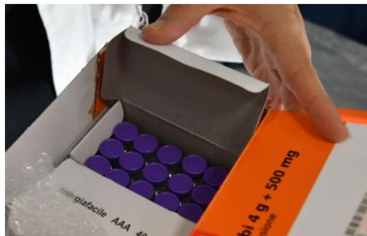
Prosegue la campagna vaccinale in regione

«L'Rt è 0,94 – conferma Donini – ma i numeri stanno crescendo a causa della circolazione sul nostro territorio della variante inglese, particolarmente contagiosa, e dell'aumento dei contatti derivante da 12 giorni di zona gialla. Oggi i nuovi contagi sono stati 1.500, con 1.000 sintomatici». Al momento, comunque, «siamo in una situazione ancora compatibile con la zona gialla», assicura l'assessore. Che poi aggiunge: «Vedere 10.000 morti in Emilia-Romagna è stato uno