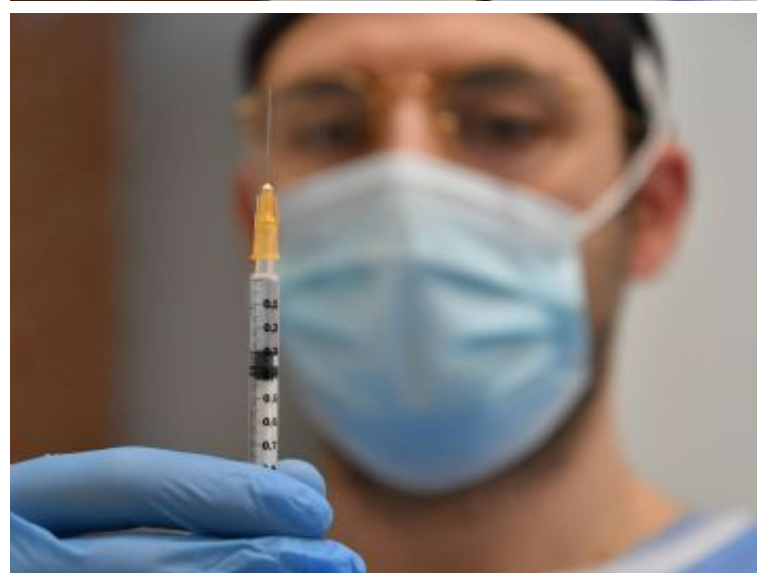
Il punto vaccinale in Fiera a Forlì