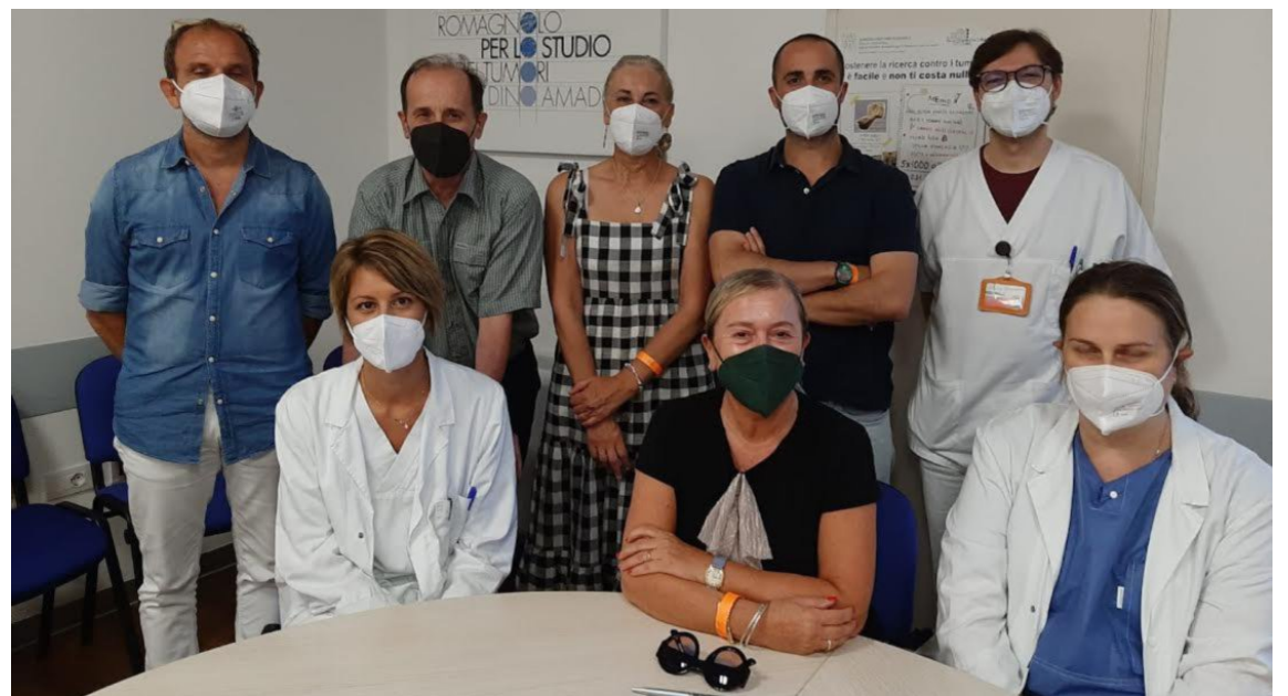
Siglato dai tre sindacati confederali il protocollo integrativo con l'Irst di Meldola

renti criteri, il passaggio di fascia per buona parte del personale da tempo fermo al primo livello e l'impiego della direzione per un confronto annuale. Inoltre si evidenzia il riconoscimento economico di euro 3.000 per chi ha già ora condizioni tali che soddisfano i criteri utili per un doppio passaggio». Per concludere viene valutato anche il riconoscimento entro il 31 dicembre di quest'anno di 1.000 euro per tutti i dipendenti che rientrano nel contratto. «Una trattativa lunga, iniziata un anno fa - sottolineano le segreterie -, che arriva oggi a conclusione e di cui, pure evidenziando i lati positivi, occorre rimarcare quanto lavoro sia ancora di fare».