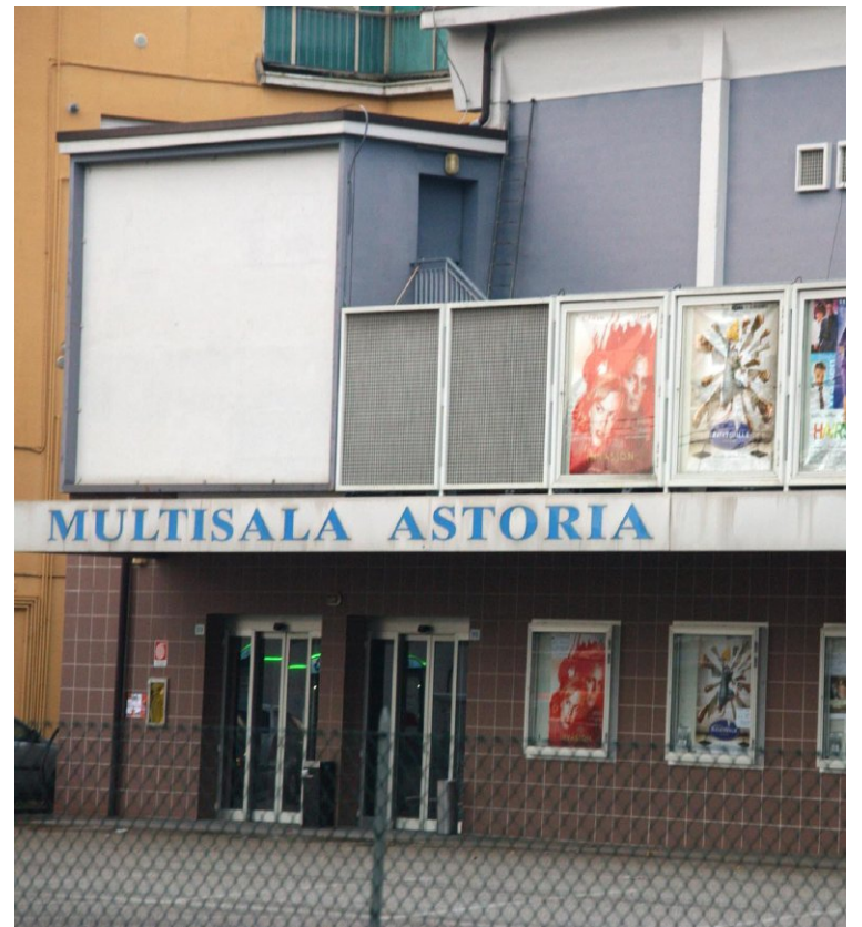
La multisala Astoria a Forlì

L'intervento ha interessato anche la climatizzazione delle sale. «Sì, per cercare di eliminare quanto più possibile l'uso del gas. Sarà un impegno e uno sforzo, per noi e i tecnici che ci affiancano: ma del resto abbiamo sposato in toto le linee di indirizzo nazionali, rivolte a un risparmio energetico inevitabile, e che ormai è comunque nello spirito di tutti». Anche all'Arena Eliseo di corso della Repubblica «abbiamo sostituito le precedenti