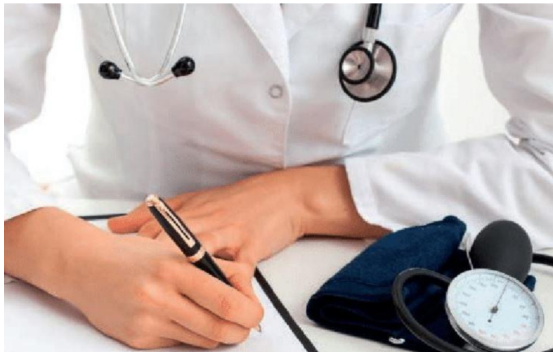
L'Ausl Romagna ha replicato ai problemi sollevati dai medici di base

Per quanto riguarda il malfunzionamento della rete Sole evidenziato dai medici forlivesi, l'Ausl precisa: «La consultazione da parte dei medici di base della documentazione relativa ai pazienti è prevista invece formalmente tramite l'ac-