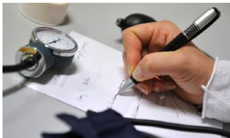
Restano vacanti diversi posti per medici di base

Mancano i medici di base, soprattutto nelle zone montane. In piena pandemia la Regione si trova ancora una volta con un vecchio problema che da tempo non riesce a risolvere: la carenza di medici di medicina generale, soprattutto nei territori più svantaggiati come la montagna e la bassa ferrarese. All'ennesima chiamata per assegnare posti di assistenza primaria, infatti, la metà delle sedi messe a disposizione è rimasta vacante. Nella provincia di Forlì-Cesena sono rimasti vacanti addirittura 8 incarichi su 12. Secondo quanto si legge nel "Prospetto riassuntivo delle ulteriori assegnazioni degli incarichi di assistenza prima-