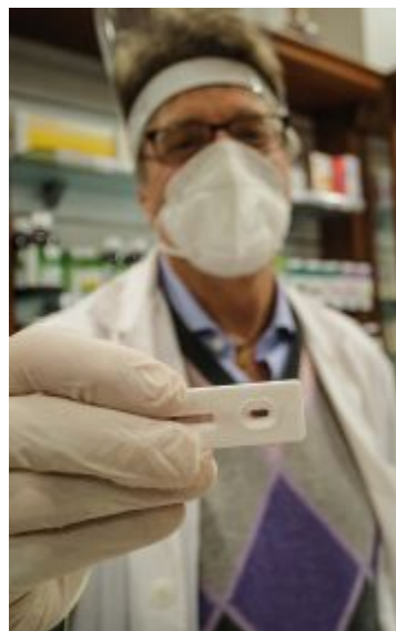
L'esito del tampone

Mezzo milione di tamponi rapidi in tre mesi, il 3% risultato positivo. Sono questi i numeri della campagna di screening epidemiologico messa in campo dalla Regione Emilia-Romagna e condotta completamente su base volontaria. Dal 21 dicembre al 21 marzo sono stati 531.318 i test effettuati in 829 farmacie emiliano romagnole aderenti, corrispondenti al 61% del totale delle strutture. Di questi test rapidi 16.092 sono risultati positivi, per il 3% del totale; le successive verifiche condotte attraverso tampone molecolare hanno confermato 12.197 positività (di cui già si conosce il risultato), ovvero il 2,3% del totale. I "falsi positivi", ovvero i casi di positività "smentiti" dal tampone molecolare, sono quindi stati 3.895. In Romagna i test eseguiti in tre mesi sono stati 122.350, con un tasso di positività del 3,3% e circa 11 cittadini su 100 ad effettuare un tampone. La campagna di monitoraggio dell'epidemia era stata inizialmente rivolta ai ragazzi delle scuole e ai loro familiari e alle categorie più a rischio, che potevano accedere al test gratuitamente; per il resto della popolazione è stato invece istituito un prezzo calmierato di 15 euro frutto dell'accordo tra la Regione e le associazioni dei farmacisti. Un quinto dei tamponi, più di 117mila in Regio-