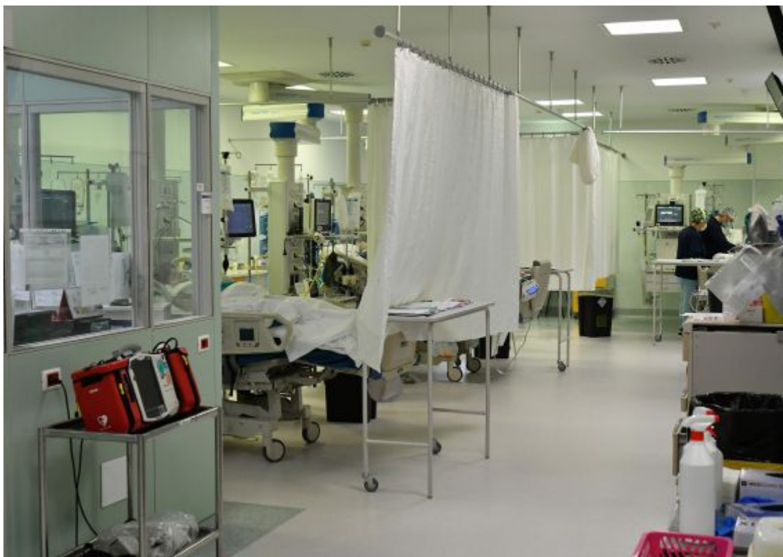
Il reparto di Terapia intensiva dell'ospedale "Morgagni Pierantoni"

Ci vorranno, dunque, altri 6-7 giorni per avere, poi, i primi riscontri tangibili in tal senso. Primi, poiché la curva delle degenze inizierà a flettere dai reparti