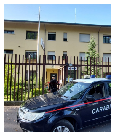
Carabinieri della stazione di Ronco

nore di 14 anni non imputabile. L'operazione è inquadrata nell'ambito dell'intensificazione dei servizi di contrasto ai reati predatori disposti dalla Compagnia carabinieri di Forlì, nelle aree urbane e commerciali di maggiore affluenza e ha visto la sinergia dei militari della stazione di Ronco, coadiuvati dai colleghi di Villafranca.