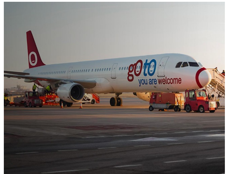
GoToFly punta ad offrire nuove opportunità ai viaggiatori