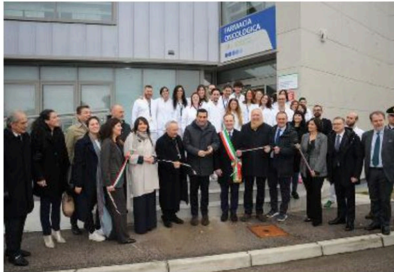
Il taglio del nastro del nuovo centro farmacologico dell'Irست

Sarà impiegata una équipe di 50 componenti tra farmacisti e tecnici di produzione. Inoltre, avrà ad alto contenuto tecnolo-