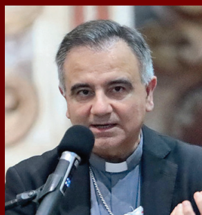
Mons. Erio Castellucci Modena