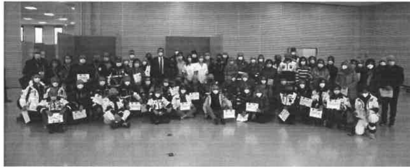
La rituale foto di gruppo con volontari, sanitari e amministratori pubblici a Pievesestina

IL RICONOSCIMENTO Politici e sanitari: «Fondamentale il contributo dei volontari»