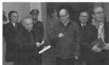
Dall'alto i volontari di Villafranca e San Martino in Villafranca. Il vescovo Livio Corazza durante la donazione degli Amici della Pieve per l'Emporio e il dono di Ospedali Privati per la Croce Verde