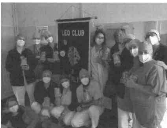
La donazione dei pandori al reparto di Geriatria da parte di Leo e Lions Club