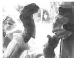
Sono 1.554 i malati nel cesenate

Il report settimanale della pandemia segna un rialzo nei contagi. Con le vaccinazioni che stanno andando a rilento: molte categorie e fasce d'età ancora non hanno accesso alla copertura con la 4 a dose. Inoltre tanti stanno aspettando che siano fruibili i nuovi vaccini con copertura anche per molte delle varianti e-