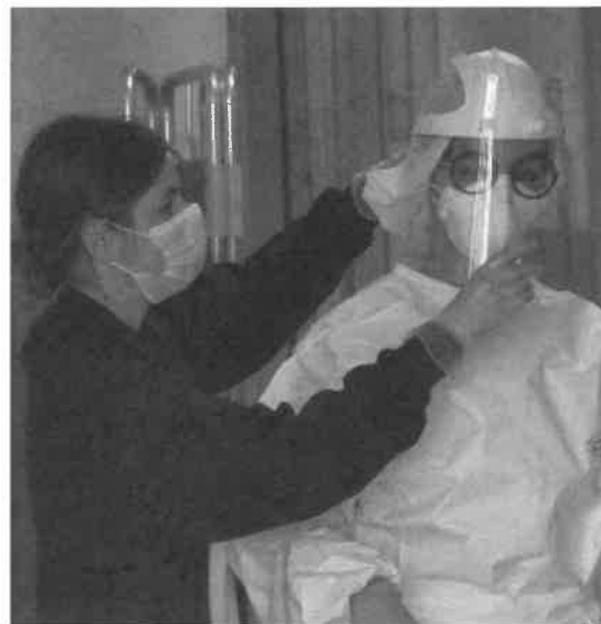
Alcuni sanitari si preparano per il servizio presso un centro tamponi

Per quanto riguarda i coloro che hanno tra i 60 e i 79 anni, hanno ricevuto la quarta dose in 6.246, pari al 21,2% degli aventi diritto. La percentuale sale al 46,7% se consideriamo gli over 80 (6.477 anziani). Con l'arrivo dei nuovi vaccini anti-Covid a formulazione bivalente è stato dato il via anche alla somministrazione della quinta dose a chi si trova in una condizione di grave immunodepressione a causa di malattie o trattamenti farmacologici che alterano la risposta immunitaria, inclusi i trapiantati, dializzati, splenectomizzati, coloro che stanno effettuando una chemioterapia immunosoppressiva o l'hanno conclusa da meno di 6 mesi, obesi. La vaccinazione potrà essere effettuata dopo almeno 120 giorni da una precedente dose o da una precedente diagnosi di infezione. Per eseguirla è possibile rivolgersi al proprio medico curante