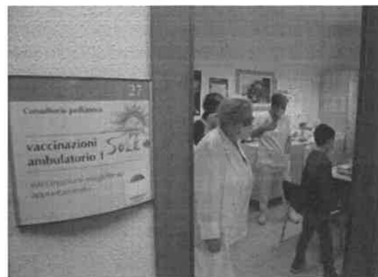
Le vaccinazioni anti-Covid per i più piccoli (Ravaglia)

«La curva dell'epidemia sale ancora, ma lo scenario è migliore rispetto