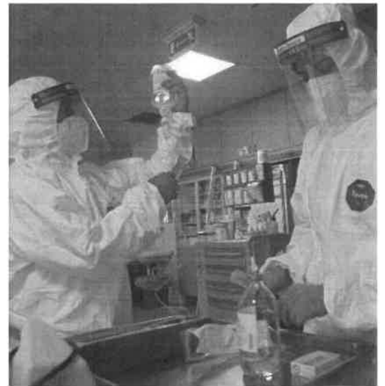
Due dipendenti dell'Ausl Romagna in un reparto Covid del Bufalini (Ravenna)

«C'è una forte carenza di personale, eppure la Regione ha interrotto i contratti a termine»