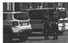
Controlli della Polizia locale