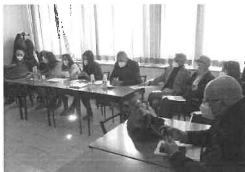
Un gruppo di medici di famiglia riminesi

Il sindacato dopo la denuncia di difficili condizioni di lavoro: «L'autonomia non aiuta i pazienti»