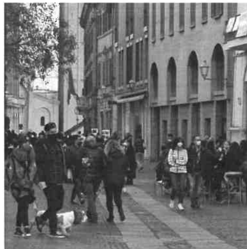
Con il calare dei contagi, si va verso un graduale ritorno alla normalità.