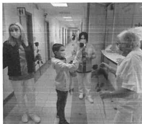
I bambini sono i più esposti al doppio contagio

Nella casistica rilevata sono emersi casi di reinfezione con Omicron da parte di chi si era negativizzato anche solo da poche settimane da Delta. Tempi ristretti legati alle differenze e alla rapida avanzata della variante sudafricana divenuta dominante anche in Romagna nell'arco di appena un mese; non a caso l'elevata contagiosità del virus modificato è parsa palese dai dati dei bollettini quotidiani. Un esempio su tutti nel Ravennate, dove proprio ieri i contagi accertati dall'inizio dell'epidemia hanno sfondato quota 100mila: erano la metà il 4 gennaio scorso.