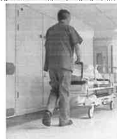
Corso di formazione per Oss

2022 e avrà una durata complessiva di 300 ore di cui 180 teorico-pratiche e 120 di stage in azienda. È possibile ricevere ulteriori informazioni sul sito dell'associazione oppure contattando la sede Ial di Forlì (0543.370507 o sedeforli@ial-emiliaromagna.it).