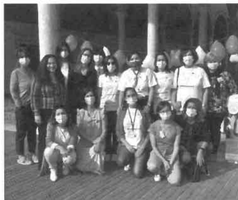
Le partecipanti all'edizione del flash mob dello scorso anno a Forlì

Mamme che allattano, papà, referenti dei gruppi di sostegno, ostetriche dei Consultori, professionisti dei servizi ospedalieri, Centri per le famiglie e Comuni, saranno insieme per ricordare quanto l'allattamento al seno sia importante, per dare informazioni e risponde-